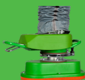
EASY : gachette