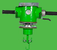
MASTER : poignée rotative