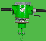
MASTER : poignée rotative