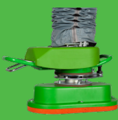
EASY : gachette