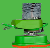
EASY : gachette